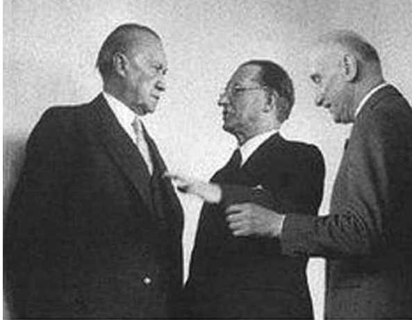
1952 – Incontro tra Adenauer, De Gasperi, Schuman, padri fondatori dell'Europa unita

ricazione tra il modo di considerare la stessa nozione di “reddito di cittadinanza”: da alcuni riferito ad una prassi politico-sociale capace di condurre il soggetto all’inclusione sociale attraverso il lavoro (riprendendo l’ispirazione socialista e cristiana), da altri visto come diritto connaturato all’esistenza dell’individuo stesso, a prescindere dalla sua condizione economica e dal suo rapporto con il lavoro, ma in base al principio della completa autodeterminazione del singolo.