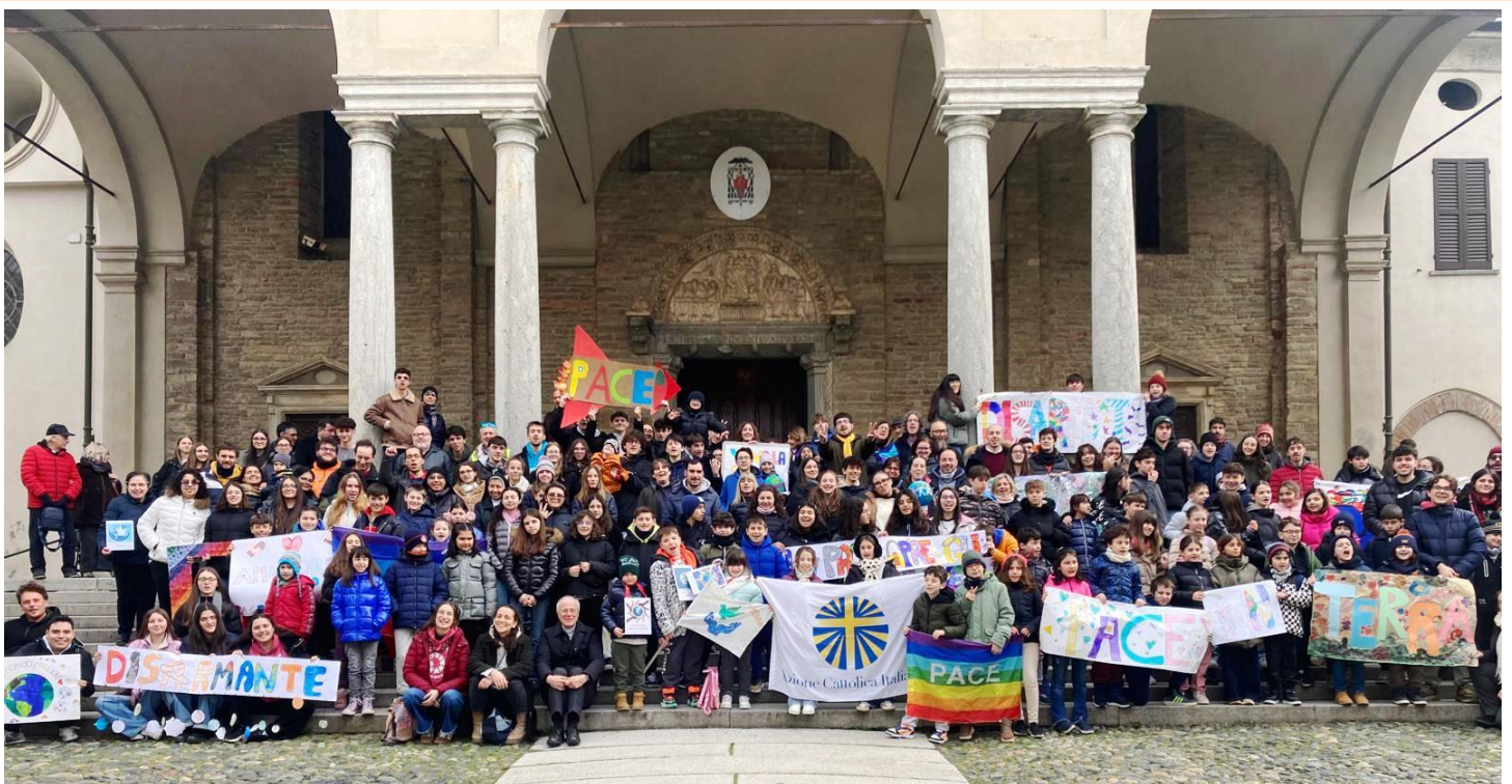
convegno Pace AC Acqui - ACR e Adulti con il vescovo L. Testore, 8.2.2026

https://www.oxfamitalia.org/disuguaglianza-erode-democrazia/